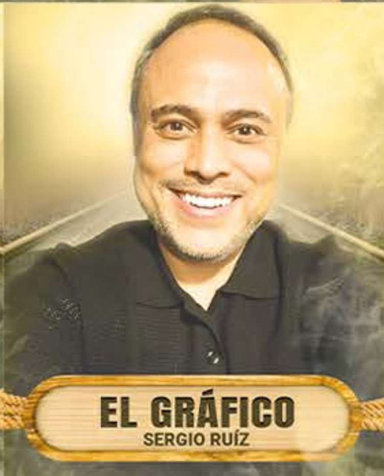
EL GRÁFICO SERGIO RUÍZ