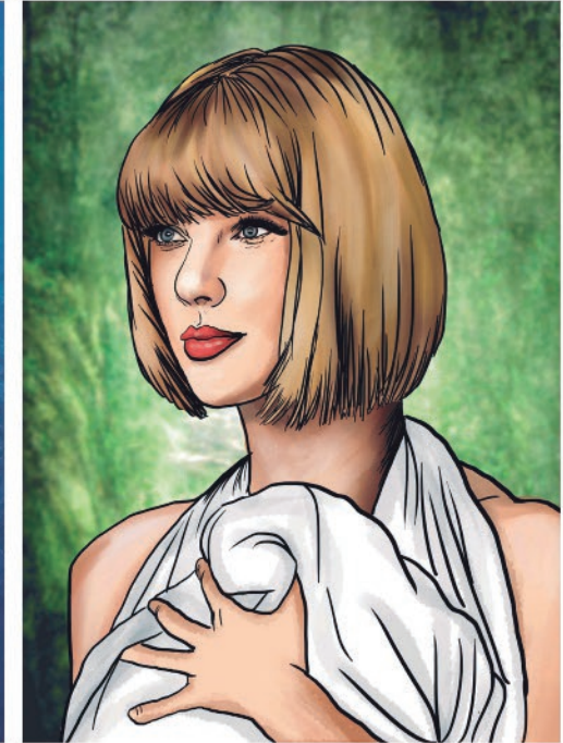
Elena por: Taylor Swift