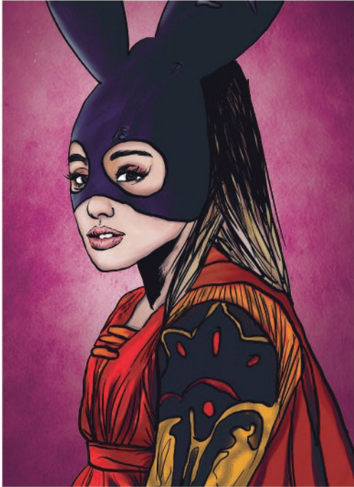
Julieta por: Ariana Grande