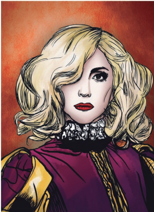
Viola por: Lady Gaga