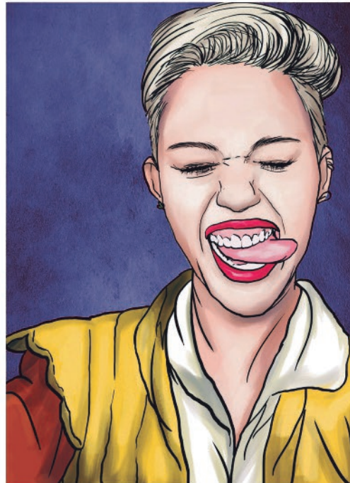
Rosalinda por: Miley Cyrus