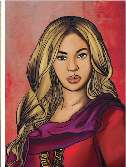
Lady Macbeth por: Beyoncé